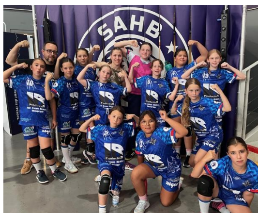
Equipe – 11 filles