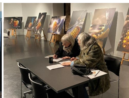
C'est tout verre