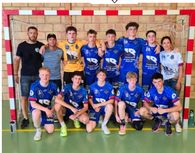
Equipe – 18 garçons