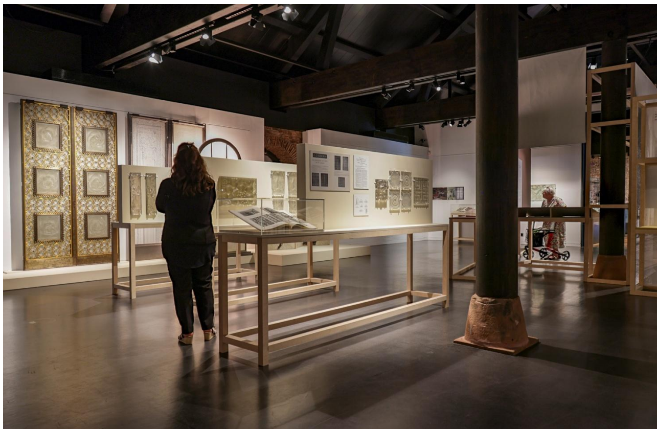
Exposition 2025 : René Lalique, architecte et décorateur

Le musée Lalique propose chaque année une programmation très riche au cœur de laquelle se trouvait en 2025 l'exposition « René Lalique, architecte et décorateur ». Plus de 32 000 visiteurs sont venus la découvrir du 1 er mai au 2 novembre. Ils ont pu voir des créations pour l'Exposition internationale des arts décoratifs et industriels modernes de 1925, mais également des éléments de fontaines, des panneaux décoratifs, des portes.