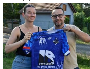
Le changement de présidence