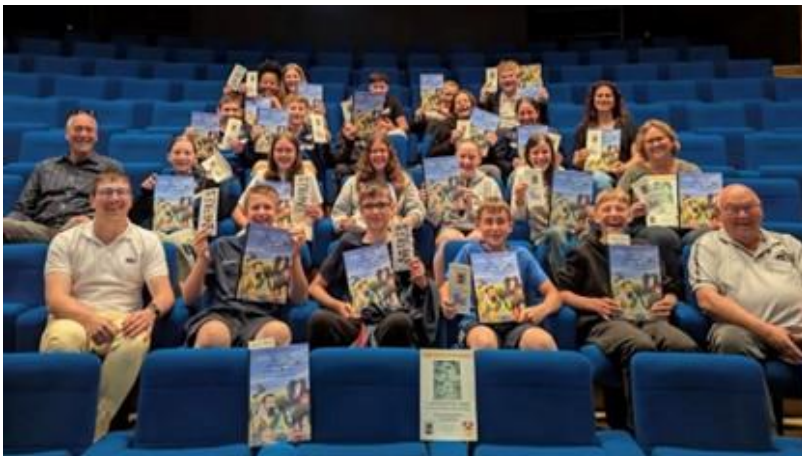
La classe de LCR du collège S. Laliq-Haviland

Nous avons l'immense honneur de vous présenter notre nouveau logo sur lequel vous retrouvez le parchemin et le Kirchberg qui apparaissent comme un clin d'œil à l'ancien. De la même façon, une tortue et sa carapace verte font référence à notre territoire de l'« Alsace Tortue », à la nature et plus particulièrement à la forêt des Vosges du Nord ainsi qu'aux champs cultivés par nos agriculteurs dans ce « Pays Secret ». La tête de cet animal, qui est devenue l'emblème de la Centrale Beurrière de Drulingen en 1947, est orientée vers la gauche. Elle symbolise un regard tourné vers le passé et donc vers l'histoire. Son côté cartoonisé transcrit un appel vers la jeunesse et le futur »